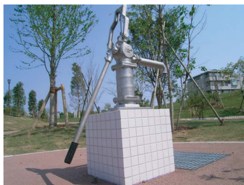
千葉県松戸市Bマンション 隣接公園内