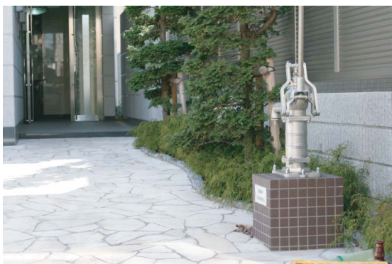
東京都江戸川区Aマンション エントランス前

東京都江戸川区、千葉県松戸市のマンションに隣接する形で防災用手押しポンプとしてご使用頂いてます。近隣住民の方も使用でき、安全なマンションが震災時に人の集まれる場所になればとの思いが込められています。