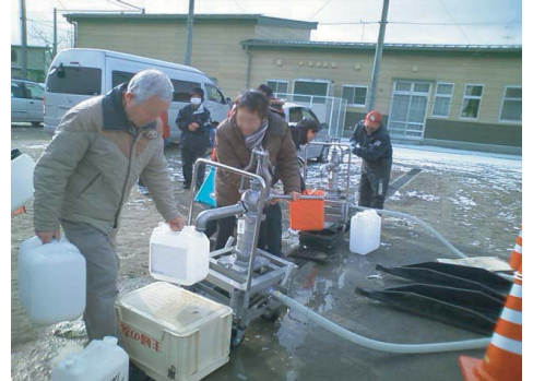
地下にある上水貯水槽より給水