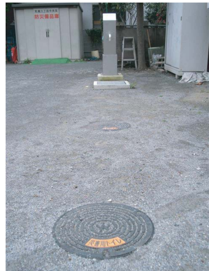
マンホールのフタにも「災害用トイレ」と明示

東京都江戸川区、千葉県松戸市のマンションに隣接する形で防災用手押しポンプとしてご使用頂いてます。近隣住民の方も使用でき、安全なマンションが震災時に人の集まれる場所になればとの思いが込められています。