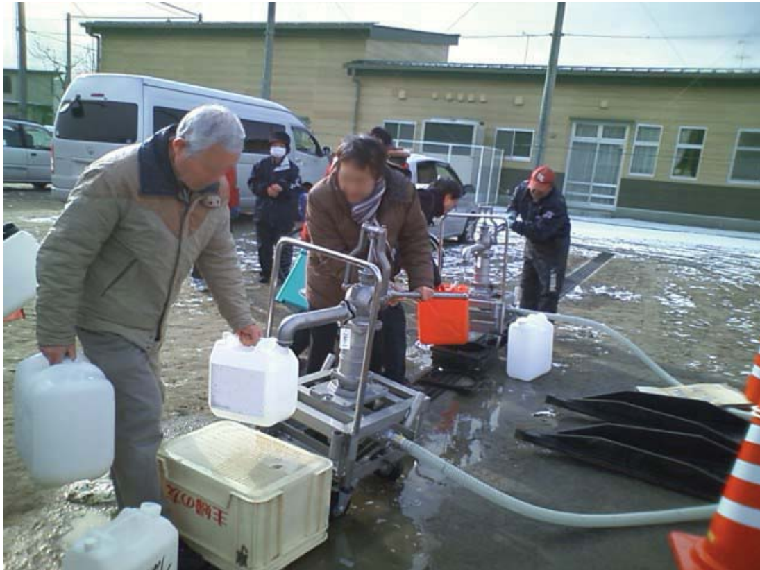
宮城県仙台市泉区 ご利用者様よりご提供