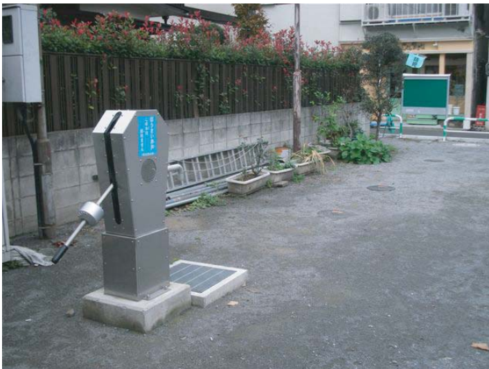
手押しポンプはZ0-III型 子供たちの安全にも配慮し安全カバーもご採用頂いております。

東京都A区役所様では手押しポンプを災害用トイレの給水用にご使用。災害時にはマンホールのフタを開け仮設トイレを設置。水洗時に手押しポンプを使用します。